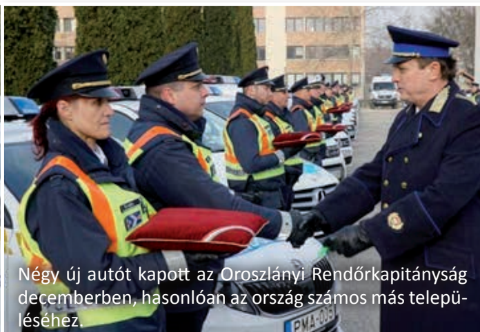
Négy új autót kapott az Oroszlányi Rendőrkapitányság decemberben, hasonlóan az ország számos más településéhez.