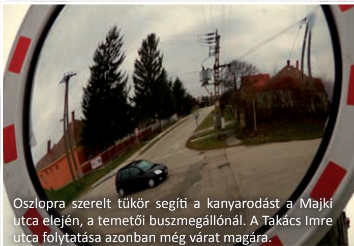
Oszlopra szerelt tükör segíti a kanyarodást a Majki utca elején, a temetői buszmegállónál. A Takács Imre utca folytatása azonban még várat magára.