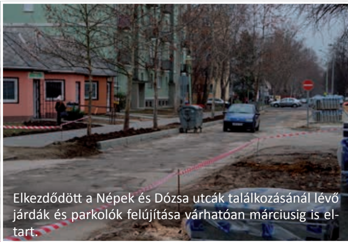
Elkezdődött a Népek és Dózsa utcák találkozásánál lévő járdák és parkolók felújítása várhatóan márciusig is el-tart.