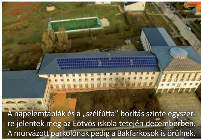
A napelemtáblák és a „szélfútta” borítás szinte egyszerre jelentek meg az Eötvös iskola tetején decemberben. A murvázott parkolónak pedig a Bakfarkosok is örülnek.