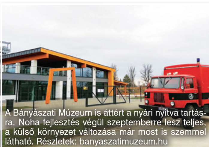
A Bányászati Múzeum is áttért a nyári nyitva tartásra. Noha fejlesztés végül szeptemberre lesz teljes, a külső környezet változása már most is szemmel látható. Részletek: banyaszatimuzeum.hu