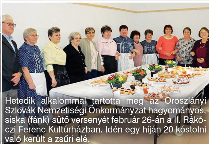
Hetedik alkalommal tartotta meg az Oroszlányi Szlovák Nemzetiségi Önkormányzat hagyományos, siska (fánk) sütő versenyét február 26-án a II. Rákóczi Ferenc Kultúrházban. Idén egy híján 20 kóstolni való került a zsűri elé.