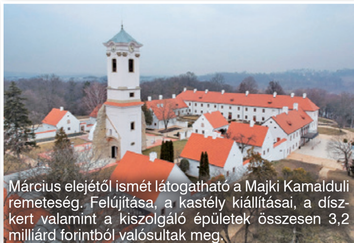
Március elejétől ismét látogatható a Majki Kamalduli remeteség. Felújítása, a kastély kiállításai, a díszkert valamint a kiszolgáló épületek összesen 3,2 milliárd forintból valósultak meg.