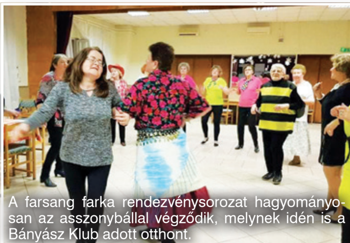
A farsang farka rendezvénysorozat hagyományosan az asszonybállal végződik, melynek idén is a Bányász Klub adott otthont.